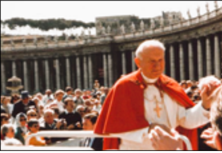
Paus Johannes Paulus II

om 'ja' te zeggen tegen Rome. Hij zal 'nee' zeggen betreffende dit bepaalde punt en ongehoorzaam zijn aan Paus Johannes Paulus II, die inderdaad tracht het voortbestaan van de katholieke Traditie te verhinderen, zonder evenwel over de intentie van de paus te oordelen. En Mgr. Lefebvre ziet dat men aan deze daad ongehoorzaam moet zijn, juist om de heiligheid van de Kerk en het priesterschap te bewaren.