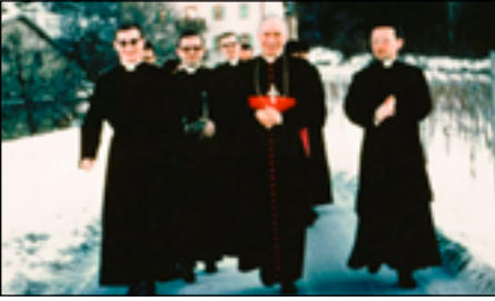
Mgr. Lefebvre, het begin in Ecône

op de voorgrond, hij staat ten dienste van de H. Maagd en het Kind Jezus, hij beschermt ze en leidt ze tijdens hun leven. Hij zal verborgen sterven, zonder de publieke manifestatie van deze vrucht gekend te hebben, van zijn daad om Maria te hebben gehouden. Hij zal geen wonderen van Jezus meemaken, hij zal Jezus enkel kennen van het leven in Nazareth.