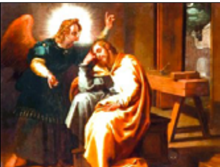
Droom van de H. Jozef

Welnu, bij beiden, bij de H. Jozef zowel als bij Mgr. Lefebvre, die hun plichten van staat goed hadden vervuld, die weloverwogen een voorzichtige beslissing hadden genomen voor zover ze konden, gaat de goede God ingrijpen. In beide gevallen gaat God hun beslissing wijzigen. Waarom? Omdat de H.