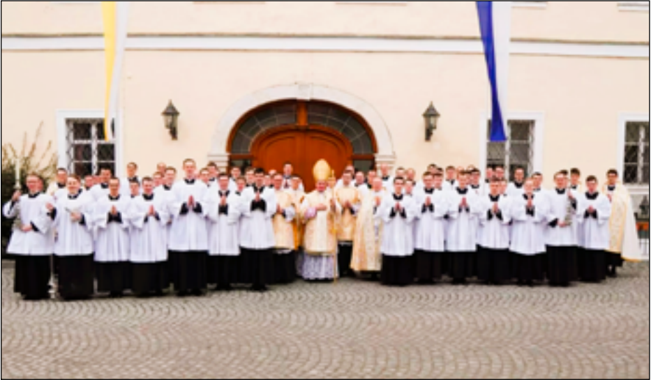
Tonsuur en lagere wijdingen Zaitzkofen 2024

door om dit priesterschap van Onze Heer te beschermen, voorzichtig aan, vaak tijdens een verborgen leven, mischien in kapellen, in loodsden, ver van de media, ver van het lawaai, en, beetje bij beetje beschermt men de vrucht, dit priesterschap, de trouw aan het onverkorte geloof, dat zicht ontwikkelt. Men beschermt het evenals zijn moeder. En de handelwijze van de Priesterbroederschap St. Pius X moet hetzelfde blijven, deze verbintenis tussen een diepgaande nederigheid, deze geest van onderwerping en tegelijkertijd de volledige trouw aan het katholieke geloof, en om met energie te worden bewogen door dit geloof en het verdedigen van het katholiek priesterschap. Dat is nu de geest van Mgr. Lefebvre en dat is nu de geest van de Priesterbroederschap St. Pius X. Welnu, Monseigneur heeft tot zijn einde, tot zijn dood, de vrucht zich niet zien ontwikkelen en Rome niet werkelijk terug zien keren tot de