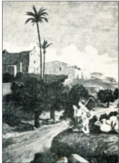
Zicht op het klooster van O. L. Vrouw van Loreto (Montefiore)

En Paschalis keert naar zijn kudde terug, bij zijn geliefkoosd heiligdom van Loreto. Voor zoveel liefde kon Jezus niet ongevoelig blijven, en Hij zou de dienaar van het H. Sacrament een heel bijzonder bewijs van Zijn genegenheid geven. Zekere morgen bewaakte hij zijn kudde. Heerlijk blauwde de lucht en duizend vogelkeeltjes verkondden de lof van de Schepper. Daar klepte de klok van Loreto, de vrome herder knielt om met de vogels mede de Heer te aanbidden, en in een opperste opwelling van liefde roept Paschalis uit: “Oh! mijn God! mocht ik U aanschouwen!”