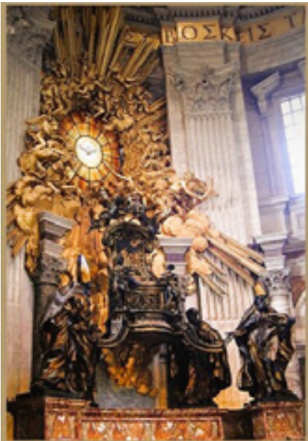
Stoel van Petrus

Hier ziet men heel duidelijk de geest van Mgr. Lefebvre, dat hij gedurende de jaren, de maanden die aan de wijdingen voorafgingen, zoals de H. Jozef veel heeft nagedacht, vaak raad heeft gevraagd, heeft overwogen, en terwijl hij niet precies wist wat de Wil van God is, de goede God toch opeens ingrijpt in de nacht na het akkoordprotocol. En dan is het heel duidelijk, voor hem is het een vanzelfsprekendheid dat de goddelijke Voorzienigheid, dat de goede God dit wil, terwijl dergelijks daarvóór niet het geval was. U ziet hier een tussenkomst, hetgeen, wat er gebeurd is.