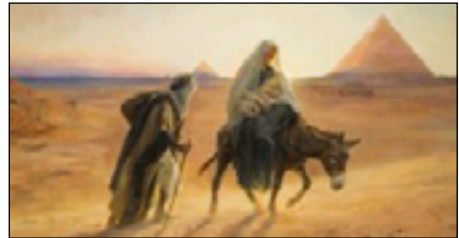
De vlucht naar Egypte

beetje bij beetje kon ontwikkelen, en de vrucht is, dat het Kind Jezus in de stilte, zonder op de voorgrond te treden via de media, zich gaat ontwikkelen. En de voornaamste missie van de H. Jozef is deze vrucht te beschermen, die vrucht van de schoot van Maria, en dit Kind alsmede Zijn Moeder te beschermen. En in zijn manier van handelen is de H. Jozef een hoofd, een chef, en neemt moeilijke beslissingen op zich, beslissingen die zich tegen zijn reputatie zullen keren – maar dat deert hem niet. Hij doet dit met een levendig geloof en een directe gehoorzaamheid: de engel heeft tot hem gesproken in een droom, en de H. Jozef gehoorzaamt. Daarin ziet men de geest van de H. Jozef, die geheel geleid en bewogen wordt door het geloof in God.