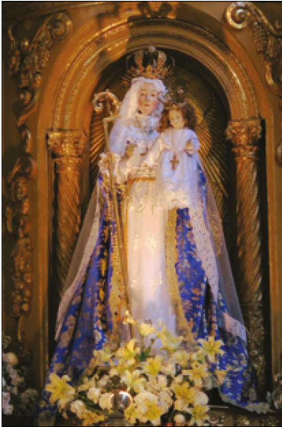
Het beeld van Onze Lieve Vrouw van Welslagen in de nis van het altaar. Het wordt publiekelijk vereerd gedurende de noveen ter voorbereiding op het plechtige feest Maria-Lichtmis op 2 februari.

Mijn Serafijnse Vader heeft aldus zijn koord om het heilig beeld gelaten en is gegaan. Tegelijkertijd was het beeld geheel en al verlicht, alsof het door de zon zelf was verzwolgen. De H. Drie-eenheid bekeek het met tevredenheid en de Engelen zongen het ‘Salve Sancte Parens’. In deze grote gelukzaligheid is de Koningin van de Engelen het beeld genaderd en is erin binnen gegaan, net zoals stralen van de zon mooie kristallen doordringen. Op dit moment is het