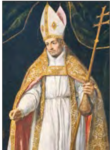
H. Thomas a Villanova

Het is waar dat er van die bevoorrechte heiligen geweest zijn, die, als het ware van geen strijd hebben geweten; hun was het gegeven zich hoog boven het zinnelijk bederf te verheffen; maar zo hoog waren zij toch niet gestegen, of zij werden nog de ongezonde uitwasemingen gewaar,